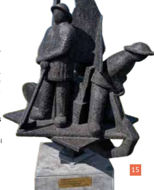
Beeld in Vollenhove (Henny Zandjans)

Twee vissers uit Vollenhove, na een slechte vangst terugkerend naar de haven, horen hun hulpgeroep echter wel. Ze proberen de ongelukkigen te bereiken, maar hun scheepjes zijn te klein om door de ijsmassa heen te komen. Een van de punters vaart terug naar Vollenhove om een zwaardere boot te halen. Met de grootste moeite lukt het de ijsvlet de ijsschots