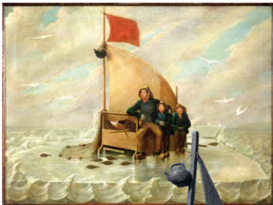
Anonim (Coll. Zuiderzeemuseum)