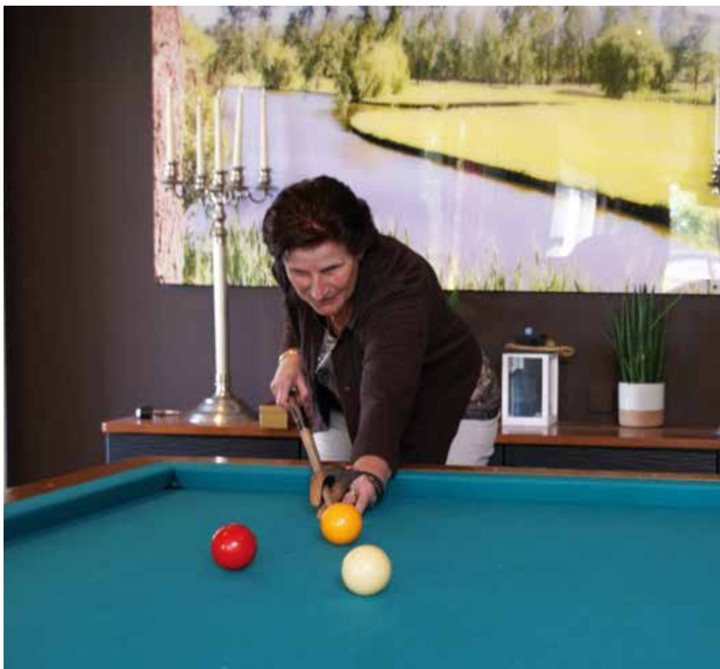
Oefenen en nog eens oefenen