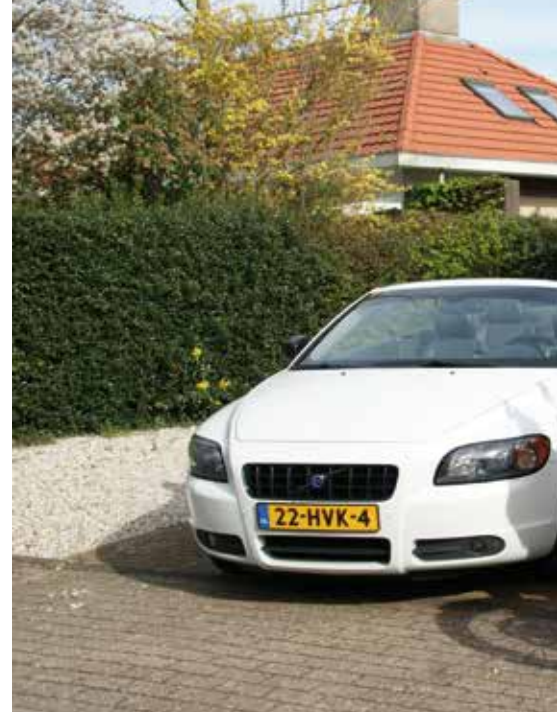
Volvo C70 en KTM 950