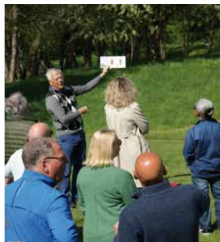
Golftheorie van Herman van Someren