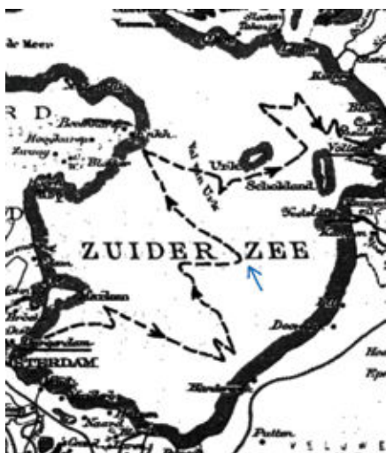
Reconstructie van de tocht; de pijl geeft de plaats aan waar Sjonnie nu woont...

of zuiden. Ze zijn gedwongen een paar maal op een grotere schots over te stappen. Het water, dat over de schots golft, doet hen verstijven van de kou. Ze vangen regenwater op in een stukje zeildoek en eten rauwe botten. Om hun slee lichter te maken, hebben ze zich van bijna de gehele vangst en een aantal gereedschappen ontdaan. Ook vader Bording wil zich van de schots laten glijden, maar de zoons kunnen hem van dit plan weerhouden. Soms schijnt de redding nabij, maar kerkgangers in Enkhuizen horen hun geroep niet, evenmin als de schipper van een tjalk in de buurt van Schokland.