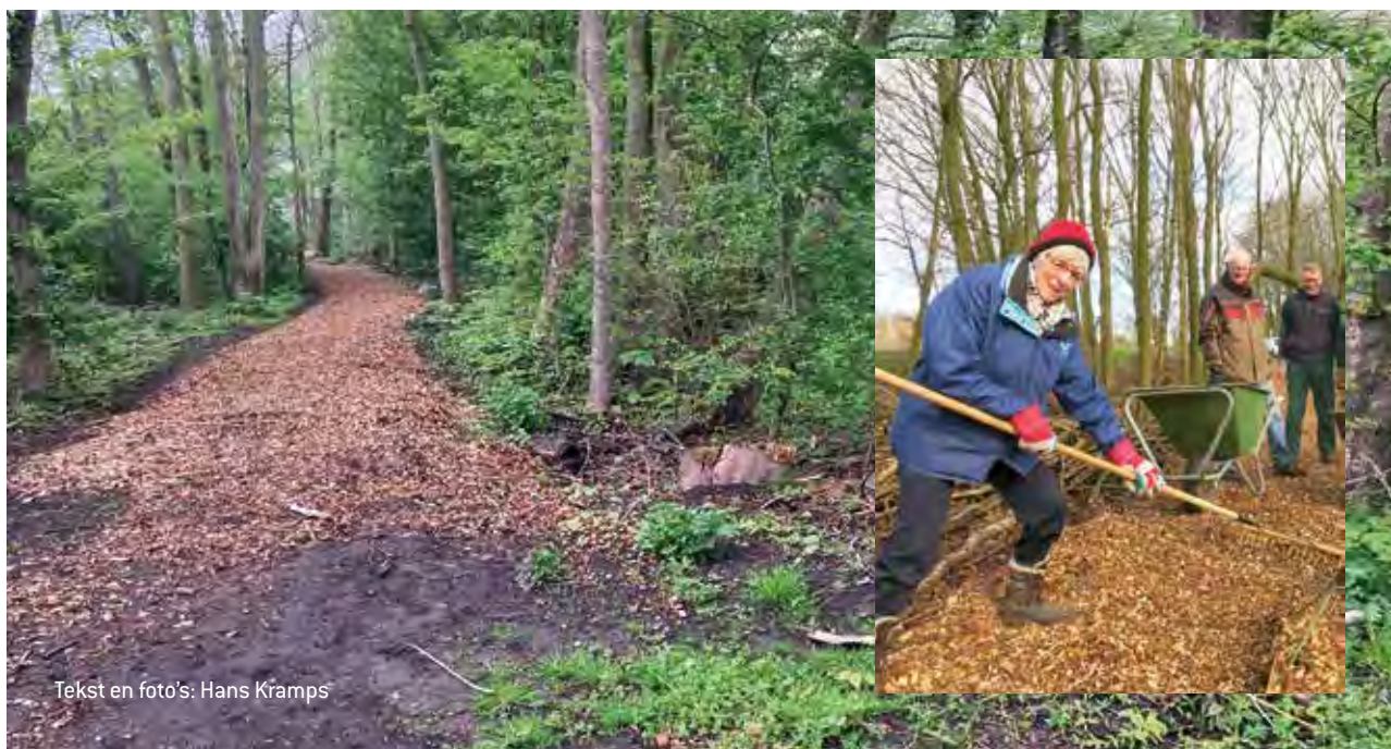
Tekst en foto's: Hans Kramps

In 2016 is door de werkgroep Natuur en Milieu het Bospad rondom de Openbare Golfbaan Dronten aangelegd. Dit is gedaan, na veel overleg met de betrokkenen, door aan de buitenkant langs de akkers het pad te maaien en aanwezige kuilen te dichten. In het gedeelte van het Bospad dat in het bos ligt zijn oude bomen gerooid en aan de kant gelegd, in eerste instantie als afbakening van het pad. Ook zijn daar egalisatiewerkzaamheden verricht. Het begin en eind van het bospad zijn voorzien van plattegronden, er zijn borden gemaakt van oude pallets (er is maar heel beperkt geld beschikbaar) en er zijn routepalen neergezet.