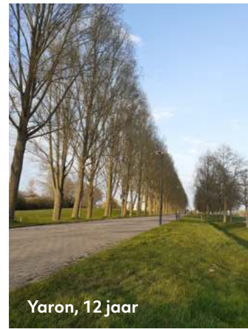
Yaron, 12 jaar