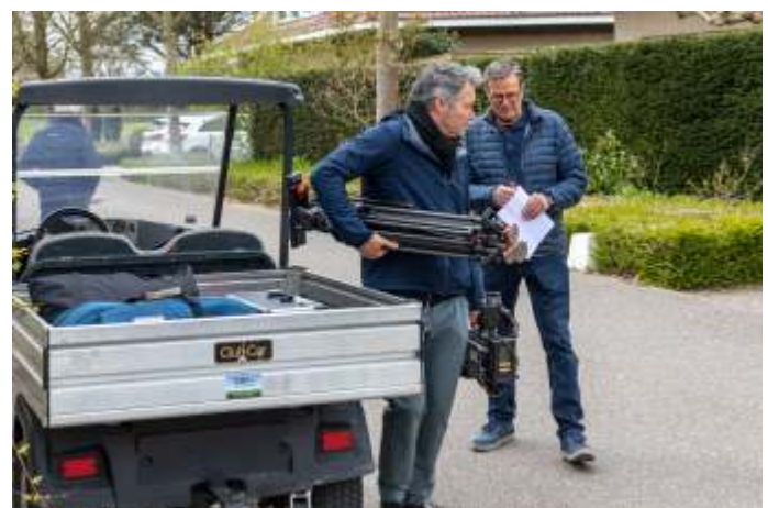
Zo'n buggy is reuze handig om de cameraploeg mee rond te rijden