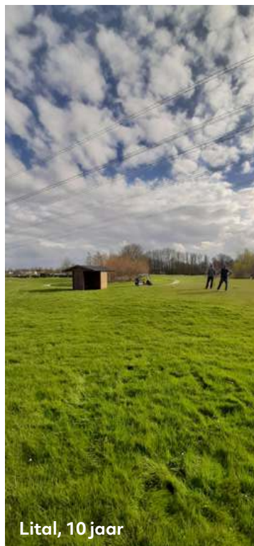
Lital, 10 jaar