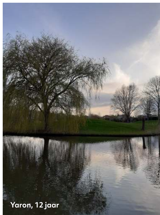
Yaron, 12 jaar