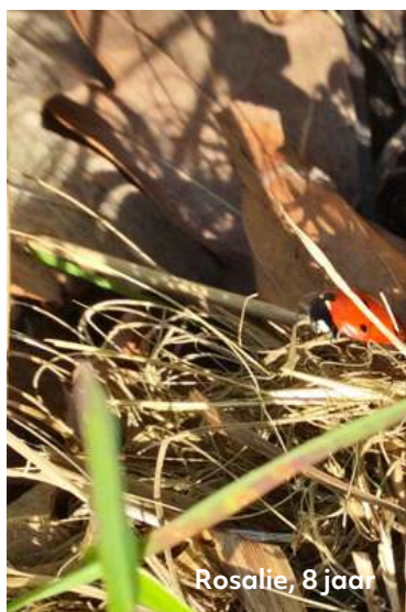
Rosalie, 8 jaar