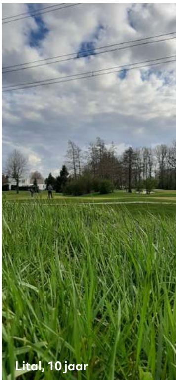
Lital, 10 jaar