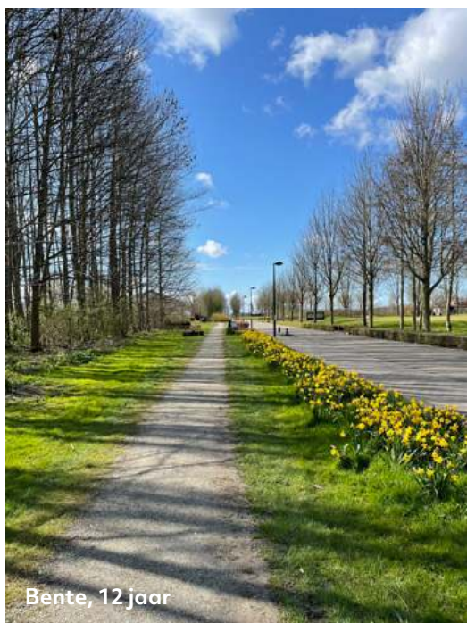
Bente, 12 jaar