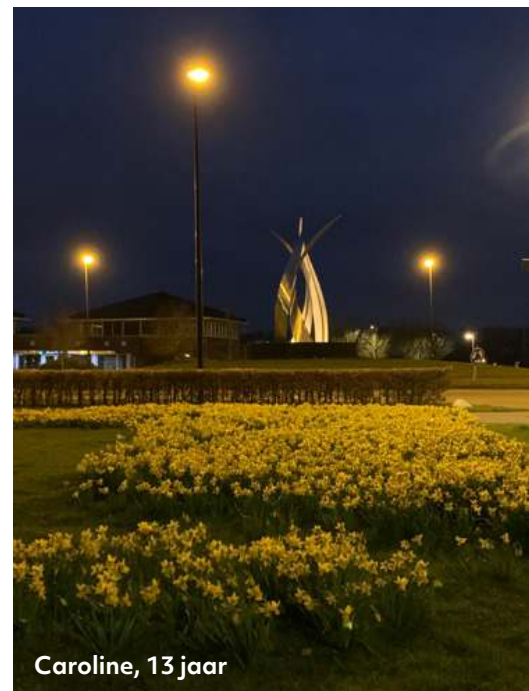
Caroline, 13 jaar