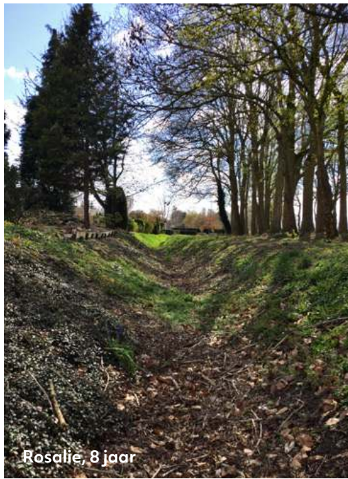
Rosalie, 8 jaar