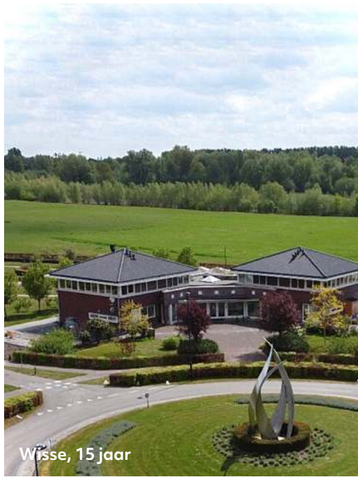
Wisse, 15 jaar