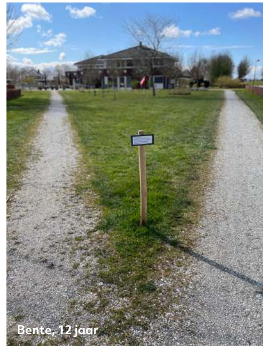
Bente, 12 jaar