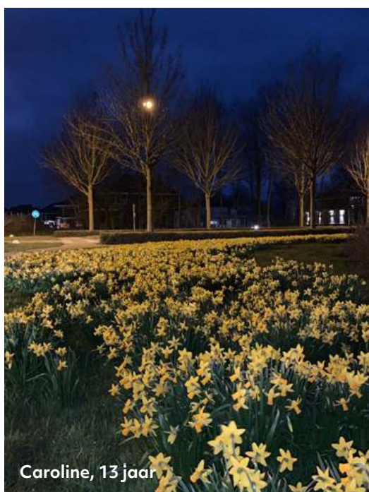
Caroline, 13 jaar