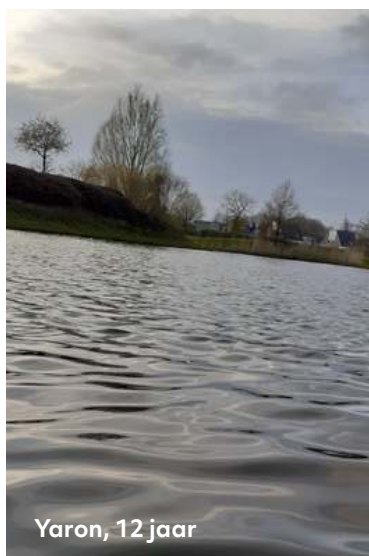
Yaron, 12 jaar