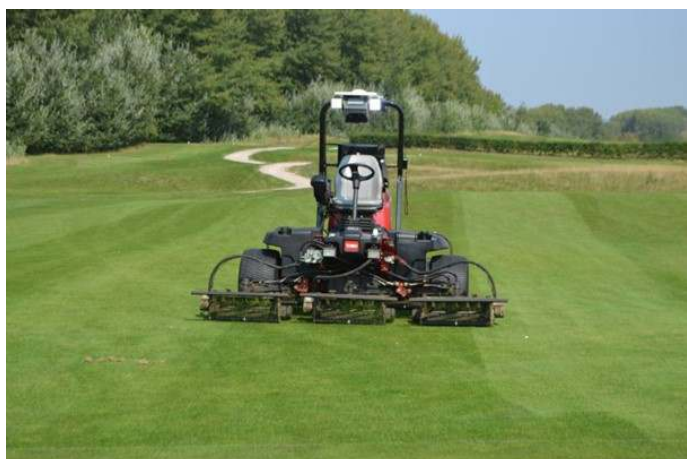
Fairwaymaaier op GPS