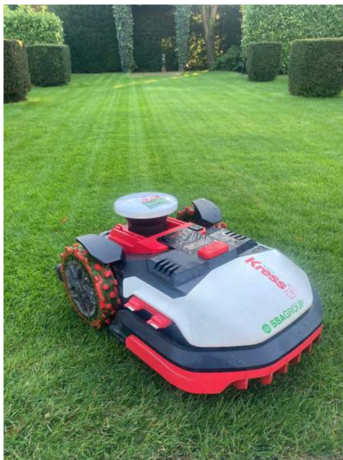
RTK Kress maaier bij bewoner van de Golf Residentie