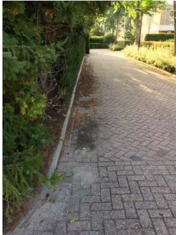
Hoek Golfresidentie/Zomer: veegbeheer verharding niet op orde.