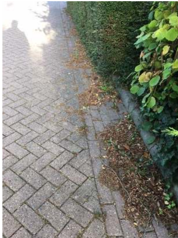
Hoek Golfresidentie/Zomer: veegbeheer verharding niet op orde.