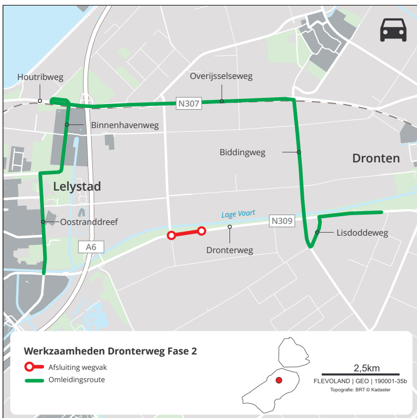
Fase 2b - maart/april 2021

Aanleg rotonde Swiferringweg/Larserringweg. Het verkeer wordt langs de werkzaamheden geleid.