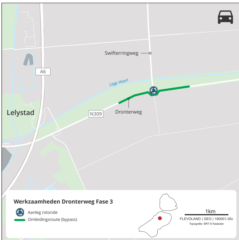
Fase 2a - maart/april 2021