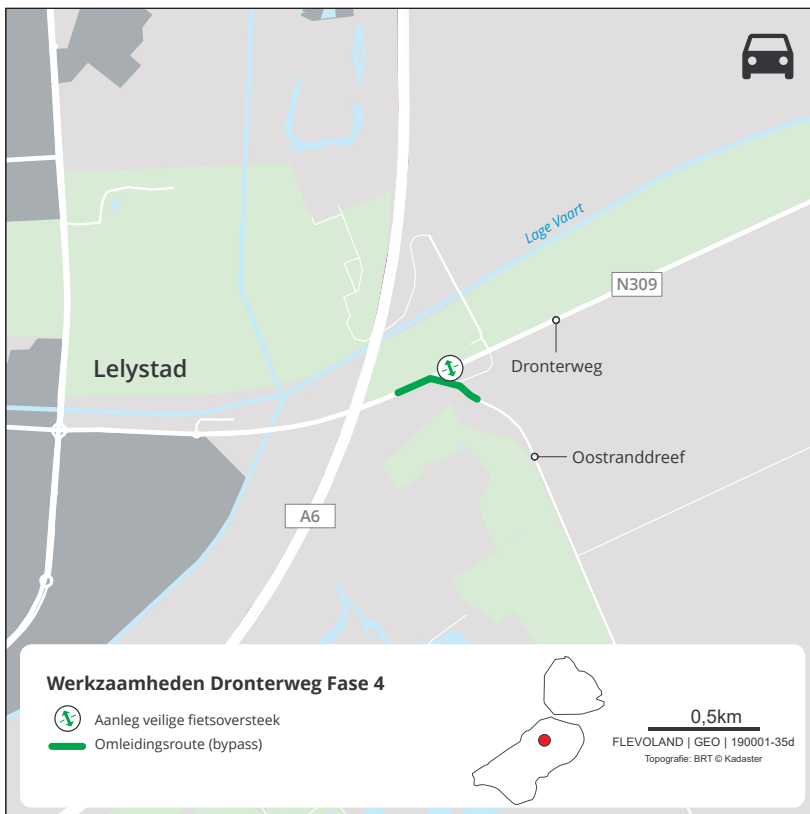
Fase 1b - november 2020

Aanleg veilige fietsoversteek Larserringweg. Werkzaamheden worden gelijktijdig met de vervanging van de asfaltdeklaag tussen de Larserringweg en de Swiferringweg uitgevoerd. Weggebruikers worden ter plaatse omgeleid.