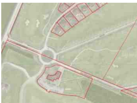
De weg Golfresidentie ligt ter hoogte van De 4 Seizoenen op grond van PRD/Mourik