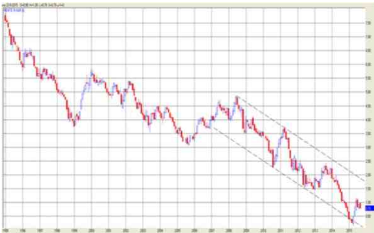
figuur 1: de Nederlandse tienjarige rente vanaf 1995