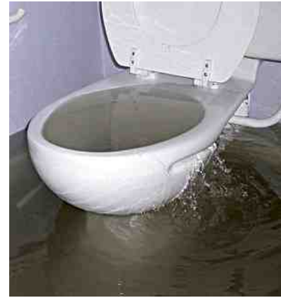
overstromend toilet (stock foto)

Wat zag je? "Met een takel aan zo'n grote vrachtwagen waren ze bezig één van de beide pompen uit de drek te takelen. Ik denk dat die put wel zo'n vier meter diep is en hij stond behoorlijk vol. Toen de pomp op het droge was, konden de mannen met veel moeite het pomphuis en het inwendige van de pompen vrijmaken van textiel. Een hele onderbroek, een paar poetslappen en een deel van een handdoek of wat daar op leek kwam er uit beide pompen samen. "Met de drollen er nog in" schaterlacht Hans.