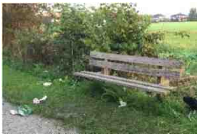
foute boel