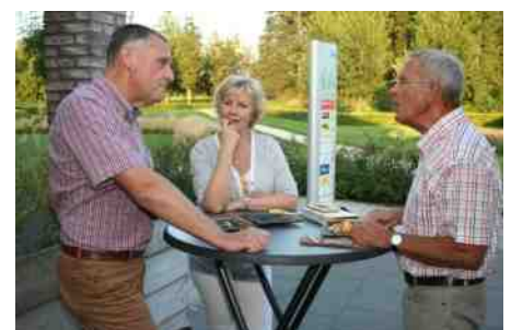
beelden barbecue