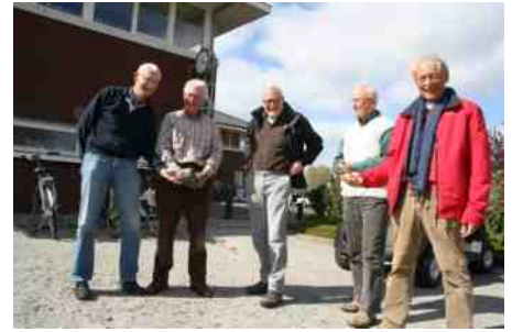
Het Klusteam