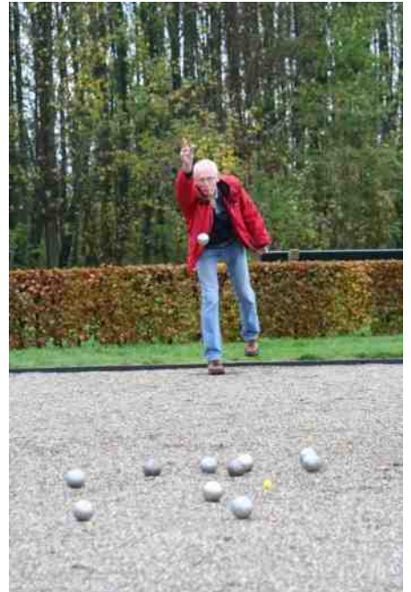
Jeu de Boules vóór renovatie