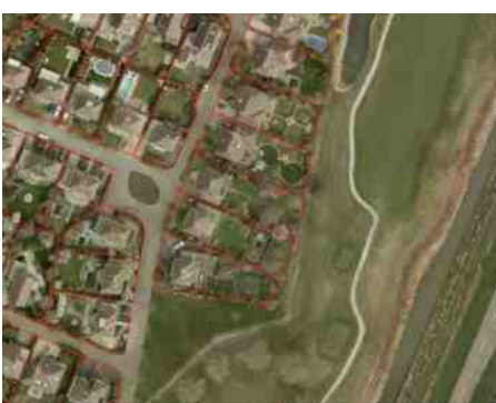
Kadastrale grenzen hole 4