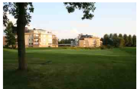
Appartementsgebouwen van de VvE90

Vanaf begin mei zal gewerkt worden aan de daken van de vijf appartementsgebouwen aan de Winter. In 2015 zijn de daken aan de voorkant van de gebouwen vernieuwd. Nu is de rest van de daken aan de beurt. Dit om verdere lekkages te voorkomen. Het werk zal vanaf de golfbaan goed te zien zijn, maar zal geen overlast veroorzaken voor de golfspelers. Meer info: vve90voorzitter@gmail.com