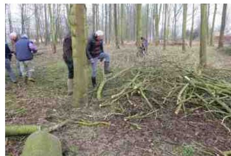
Opruimactie PRD

U wordt verzocht om geen tuinafval zoals gras of snoeihout op het talud of op het terrein van Park Residentie te deponeren maar zelf af te voeren via de daarvoor gebruikelijke kanalen. (PvdS)