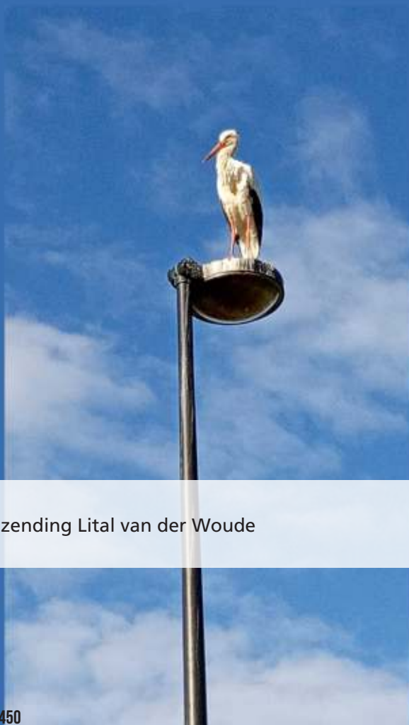
Inzending Lital van der Woude