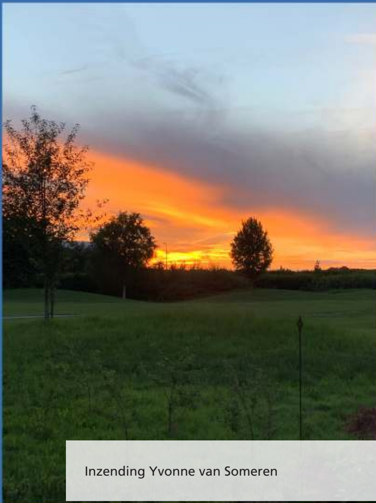
Inzending Yvonne van Someren